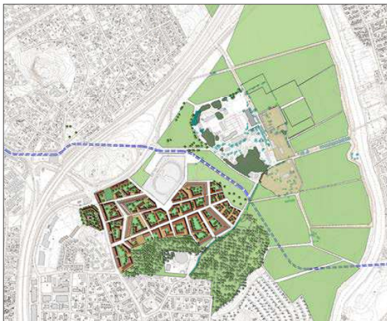
Idealuonnos Tuomarinkylän kartanon länsipuolelle sijoittuvasta uudesta kaupunginosasta. Eri aikavälien tarkasteluja. Ksv / Tapani Rauramo