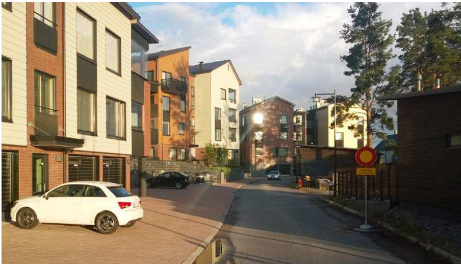
Tuomarinkylän kartanon länsipuolelle sijoittuva uusi alue voisi olla mittakaavaltaan pikkukaupunkimainen.