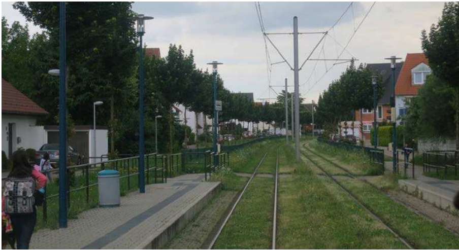
Eurooppalaisia esimerkkejä nurmiradoista ja raiteiden sovittamisesta maisemaan