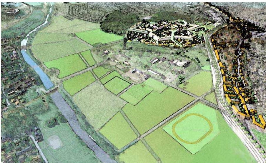
Tuomarinkartanon uuspellon pitkän aikavälin maankäyttötarkastelu. Ksv / Tapani Rauramo