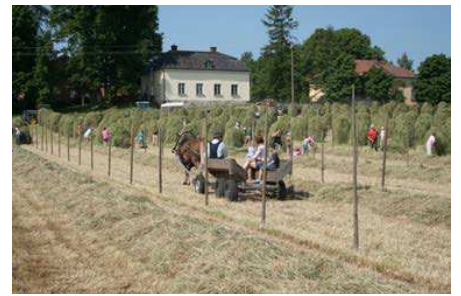
Tuomarinkylän kartano.