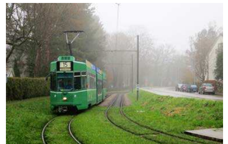
(Ylhäällä, kolme kuvaa) Eurooppalaisia esimerkkejä nurmiradoista ja raiteiden sovittamisesta maisemaan.