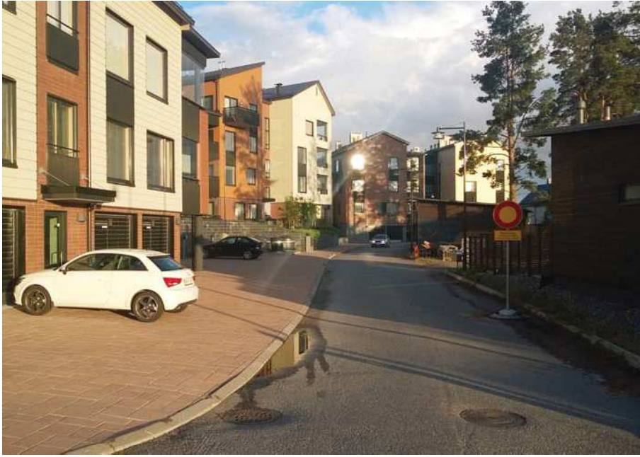
Tuomarinkylän kartanon länsipuolelle sijoittuva uusi alue voisi olla mittakaavaltaan pikkukaupunkimainen.