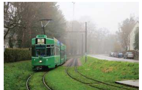
(Yllä, kolme kuvaa) Eurooppalaisia esimerkkejä nurmiradoista ja raiteiden sovittamisesta maisemaan.