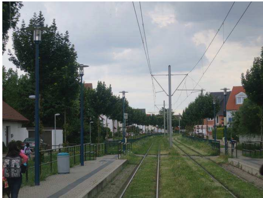
Eurooppalaisia esimerkkejä nurmiradoista ja raiteiden sovittamisesta maisemaan