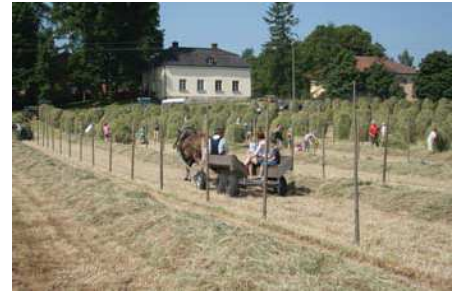
Tuomarinkylän kartano.